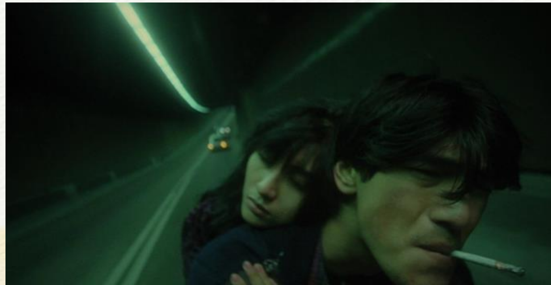
Fallen Angels, 1995

特寫鏡頭很適合用作表現有戲劇張力的場面，注重拍攝人物肩部以上的頭像，貼近人物的臉，或者通過表現物件去帶出更深層的意思。特寫可以細緻地表現面部表情和小動作，刻畫人物的內心感情，將想法傳達給觀眾。