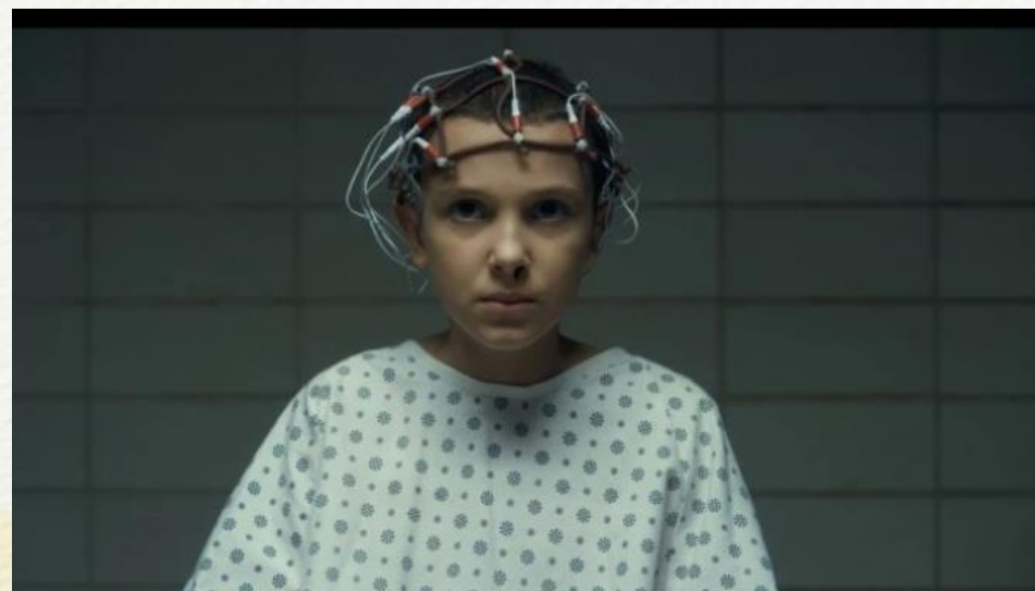
Stranger Things, 2016

平視角是最平常的主觀鏡頭，讓觀眾能以不同角色的角度去了解劇情。拍片的時候，你可以利用正面或側面的平視角度凸顯演員的輪廓、交代劇情。