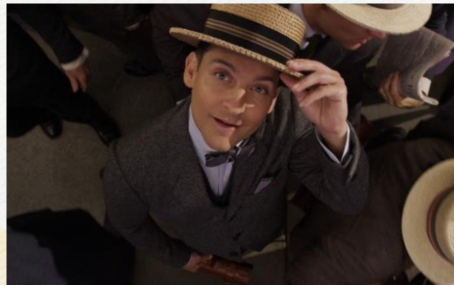
The Great Gatsby, 2013

俯視角是將鏡頭往下照，令主角看來更加卑微、無助。The Great Gatsby運用的俯視角度減慢了影片的節奏，而且可以塑造主角Nick Carraway初到紐約時怕事的形象。