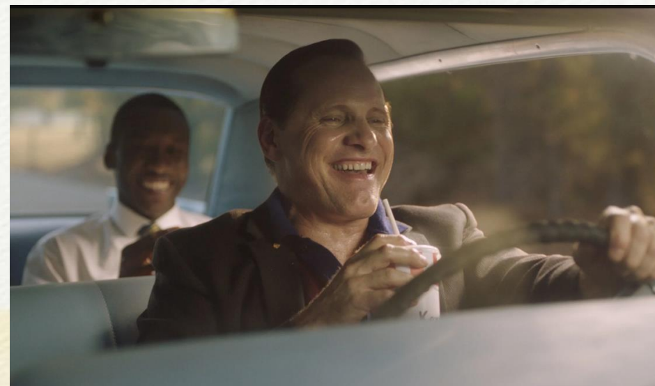
Green Book, 2018

拍攝物件局部的畫面或人物半身以上的景象。這種拍片的取景方式可以將面部表情成為畫面表達的重點，刻畫人物的性格。近景會避開聚焦在背景，讓觀眾將注意力集中於角色的互動或主體上，加強觀眾的參與感。